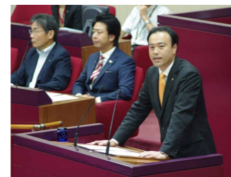
▲議案質疑の様子(9月5日)

本年9月に定例会において、市内で生産された農林水産物(その加工品含む)の販売・消費を促進することを目的とした『ふくおかさん家のうまかもん条例案』が議員提案条例として提出され、可決・成立しました。